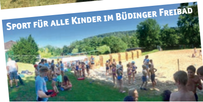
SPORT FÜR ALLE KINDER IM BÜDINGER FREIBAD