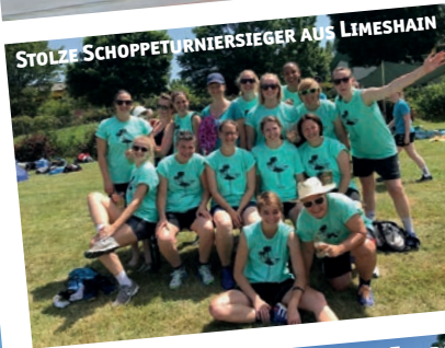
STOLZE SCHOPPETURNIERSIEGER AUS LIMESHAIN